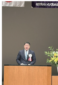
開会のことば 佐賀県知的障害者福祉協会 熊会長